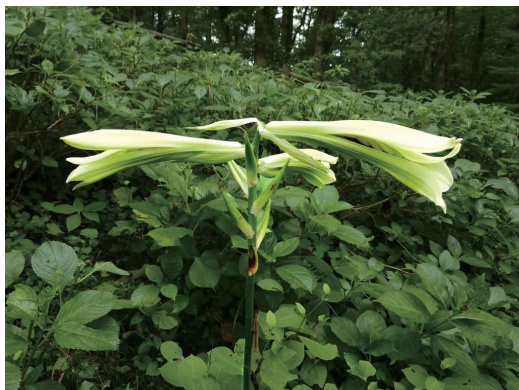
右上 / センター周辺での立ち上がる入道雲 左上 / ウバユリ 右 / アブラゼミ

埼玉県狭山丘陵いきものふれあいの里センター 〒359-1133 所沢市荒幡782 04-2939-9412 https://ikifure.info/